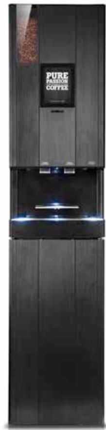
CQube LF13 Touch Screen med underskåp