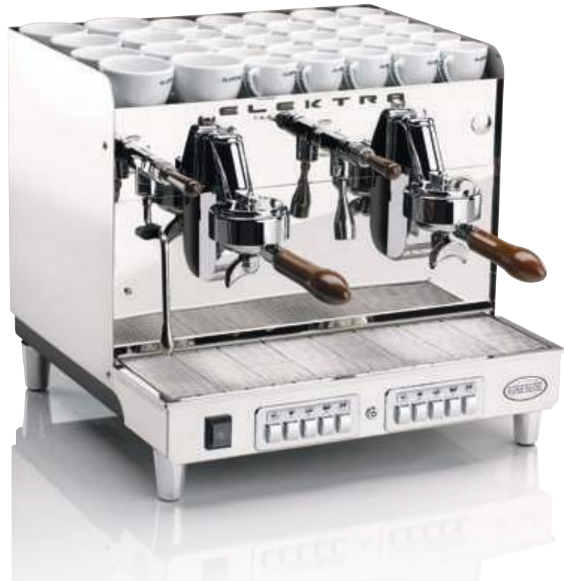
SIXTIES T3. 2 GRUPPI AUTOMATICA. ACCIAIO INOX SUPER LUCIDO SIXTIES T3. 2 UNITS AUTOMATIC. ULTRA POLISHED INOX