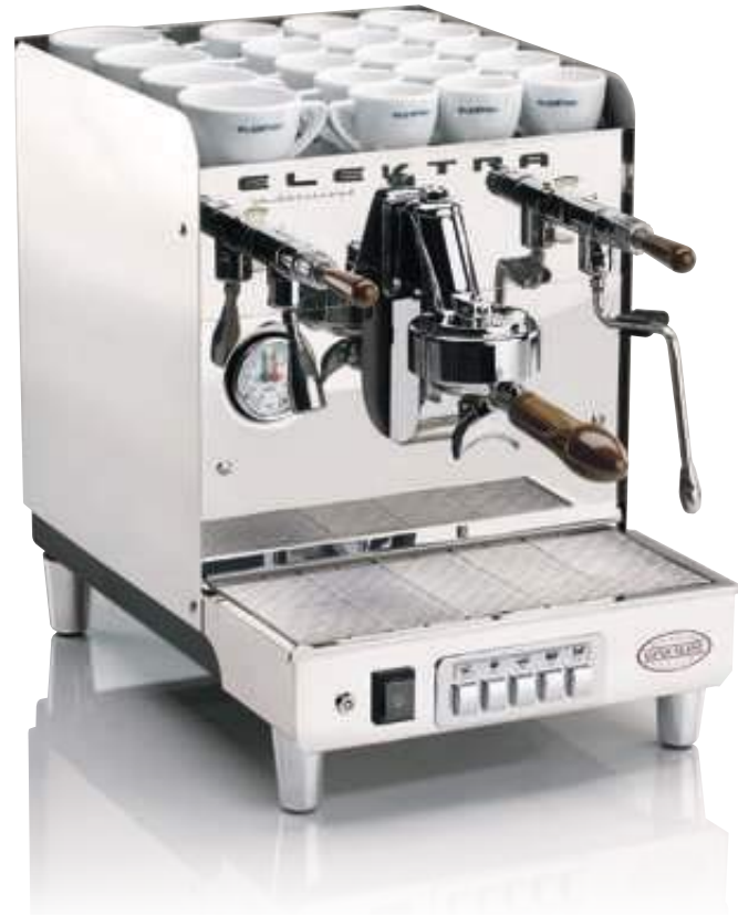
SIXTIES T1. 1 GRUPPO AUTOMATICA. ACCIAIO INOX SUPER LUCIDO SIXTIES T1. 1 UNIT AUTOMATIC. ULTRA POLISHED INOX

PICCOLI GRANDI PIACERI ITALIANI SMALL AND BIG ITALIAN PLEASURES